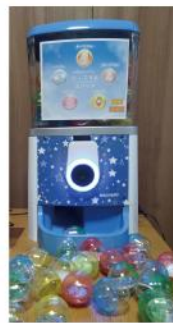
① ハンドジェスチャー操作

でガチャを楽しめます。カプセルが出てきたときに「効果音+光エフェクト」でワクワク感倍増！